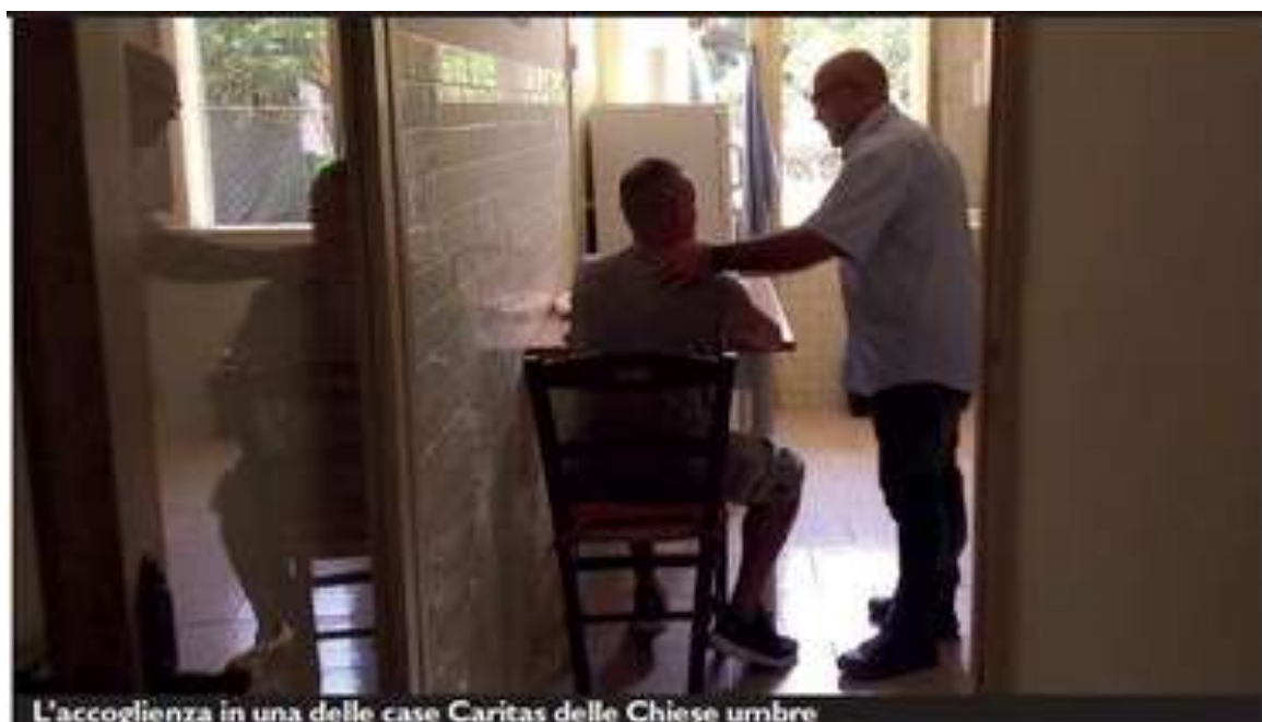
L'accoglienza in una delle case Caritas delle Chiese umbre